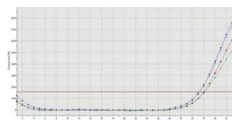
Internal Control (IC)