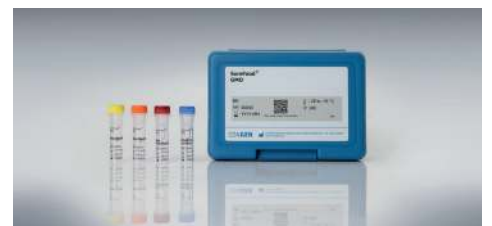
SureFood® GMO SCREEN