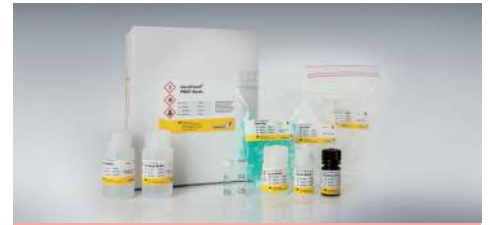
SureFood® PREP Basic, Art. Nr. S1052