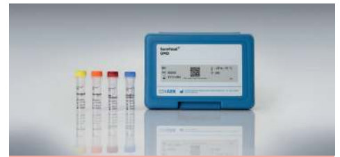
SureFood® GMO SCREEN